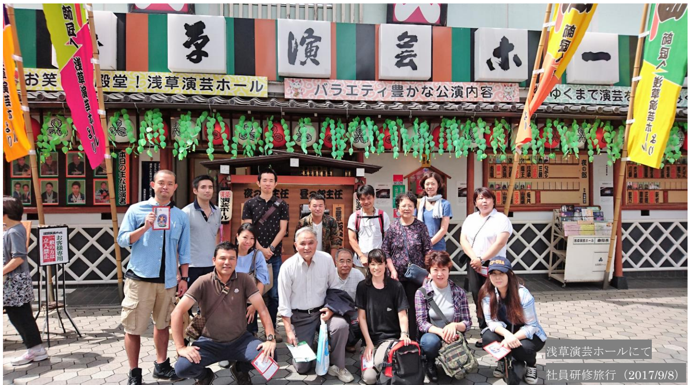
浅草演芸ホールにて 社員研修旅行 (2017/9/8)

相続対策が本屋さんでも山積みになっています。これも相続税改正（増税・平成27年）が大きく影響しています。