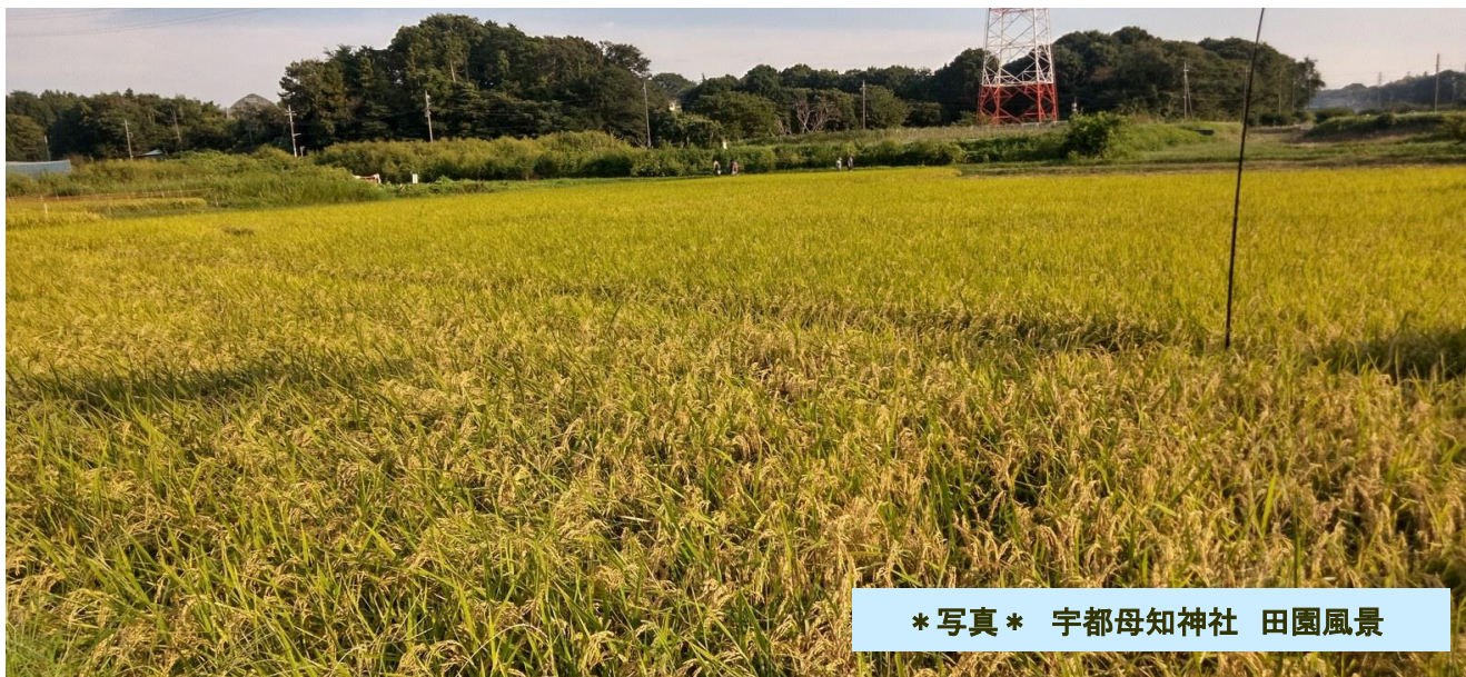
*写真* 宇都母知神社 田園風景