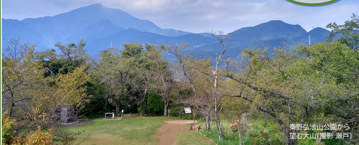
秦野弘法山公園から 望む大山